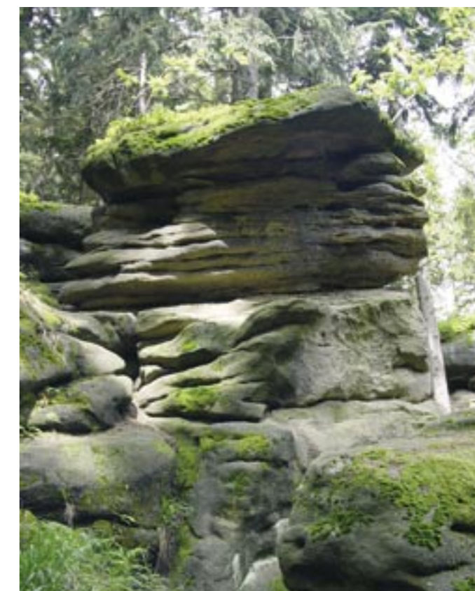
sklaní útvar v Izbách