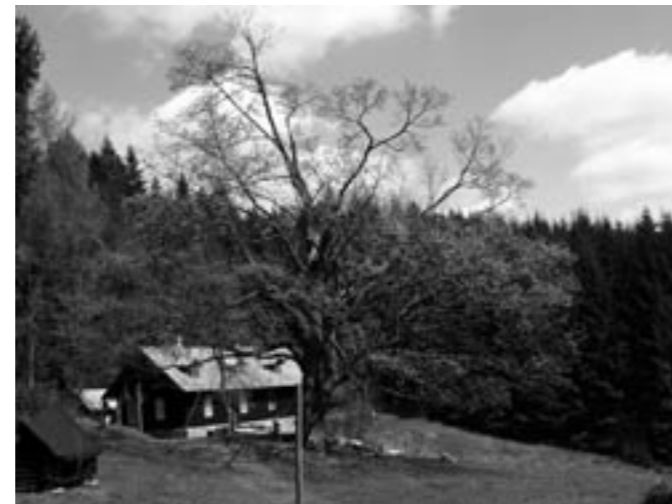
Javor na Pasíčkách