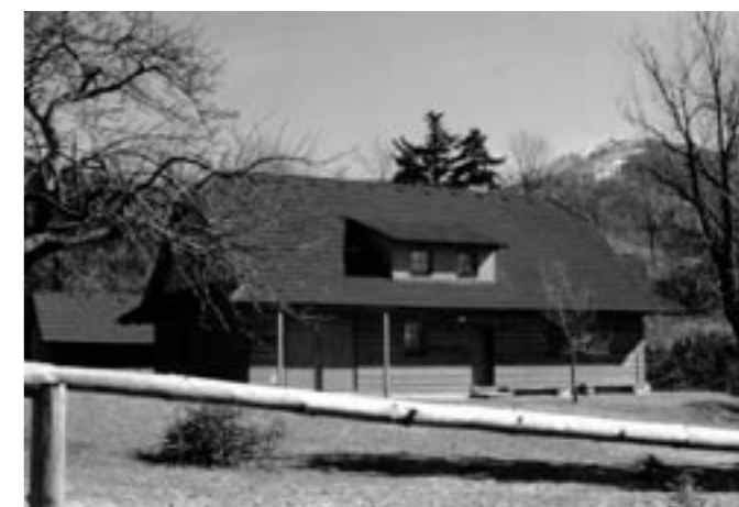
příklad podařené novostavby

Barevně vyznačené zóny je možné najít v mapách zonace (mapy v měřítku 1:10 000), které jsou uloženy na Správě CHKO Beskydy v Rožnově p. R. Zonace je vyznačena i v územních plánech jednotlivých obcí (vypracovaných po roce 1999). 1. zóna je v mapě zonace označena červeně, 2. zóna je označena zeleně a stavby se v tomto území povolují výjimečně. Ve 3. zóně (označené modře) a ve 4. zóně (označené žlutě) se stavby umísťují v souladu s územním plánem. V těchto územích uplatňujeme požadavky na dodržování tradičního vzhledu staveb. V území s vyšším stupněm ochrany je pro vydání závazného stanoviska nutné provádět i terénní šetření a v některých případech i podrobnější průzkum ve vegetačním období (botanický, zoologický).