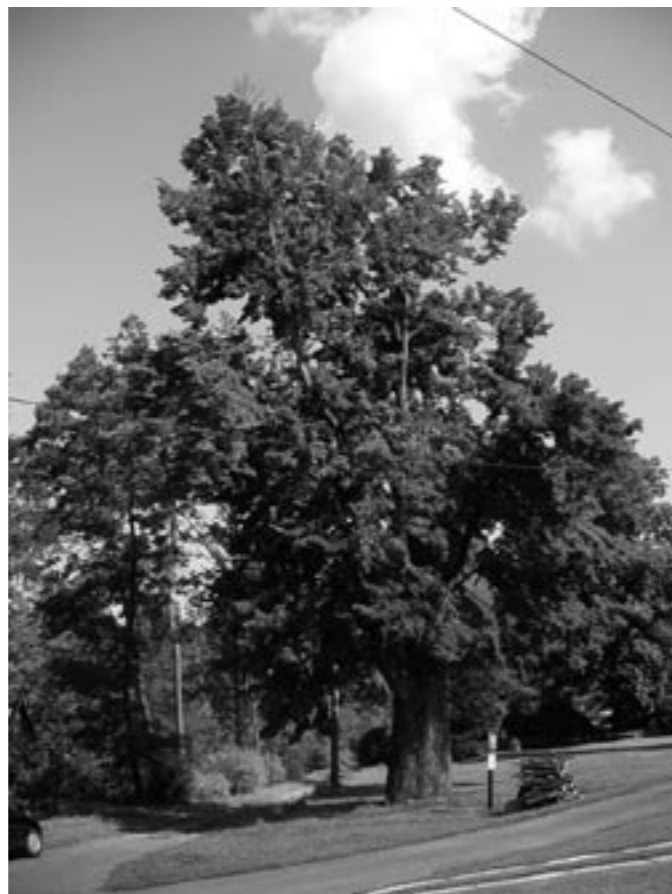
Lípa u Solanického fojtství

V CHKO Beskydy je dle zákona č. 114/1992 Sb. vyhlášeno zatím 20 památných stromů. Tyto stromy jsou v terénu označeny malým státním znakem. Na území CHKO však najdeme i jiné, významné stromy (s estetickou hodnotou, vysokým věkem, vzrůstem atd.), které si zasluhují naši pozornost. Některé z nich jsou také na památný strom navrženy. →