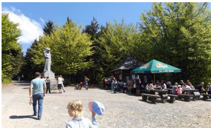
Socha Radegasta. První zastávka na cestě z Pustevn na Radhošť.