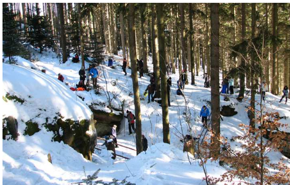
Cesta k Pulčínským ledopádům.

Nejvýznamnějším turistickým lákadlem je Valašské muzeum v přírodě, kterým ročně projde na 300 tisíc návštěvníků. Podívat se na město shůry je možno z nově vybudované Jurkovičovy rozhledny na Karlově kopci. Rožnov je také ideální východisko pro turistické a sportovní vyžití. Státisíce lidí ročně zavítají na nedaleké Pustevny a Radhošť. Toto turistické místo je jedním z nejoblíbenějších míst pro jednodenní výlety v rámci celé České republiky. Městem vede nově vybudovaná Cyklostezka Bečva. Okolní hory jsou protkány stovkami kilometrů turistických tras a cyklostezek, které skýtají optimální podmínky pro relaxační procházky i náročnější túry. Možnost péče o tělo a odpočinku nabízejí také Rožnovské pivní lázně. Přímo ve městě je možno se projít po naučné stezce Hradisko, vedoucí ke zřícenině hradu. K dispozici je i řada sportovišť včetně golfového hřiště, které se v zimě promění v běžecký okruh.