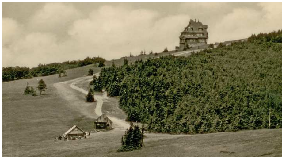
Pohled na hotel Radegast ve 30. letech minulého století.

Projekt Záchrana smilkových trávníků v EVL Beskydy (LIFE12 NAT/CZ/000629) je možné najít na www.salamandr.info v sekci projekty.