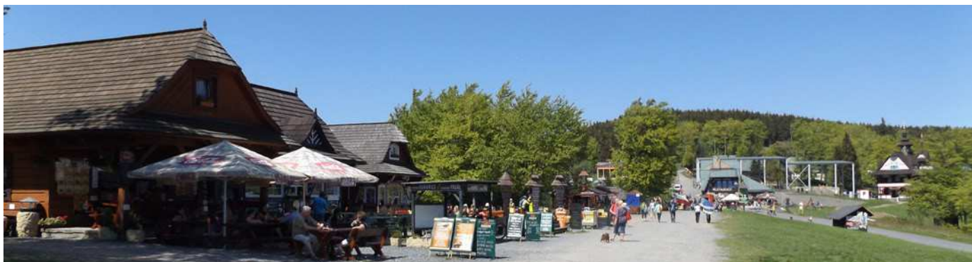
Jedním z nejnavštěvovanějších míst v Beskydech jsou Pustevny. Je to také výchozí bod pro většinu návštěvníků mířících na Radhošť. Lákadlem je také nově rostoucí Libušín.