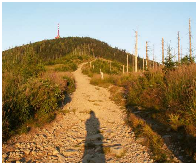
Lysá Hora. Královna Beskyd a oblíbený cíl výletu spousty návštěvníků.

Beskydy. Lidé sem jezdí hlavně kvůli přírodě. Je zde totiž jedinečná. Je dokonce tak krásná, že některá místa jsou natolik oblíbená, že se zde za den vystřídají tisíce návštěvníků. Tyto místa jsou již na takový nápor většinou zvyklá a mají vybavení, který si spousta turistů představuje. Jsou ale také místa, která tolik známé nejsou. Můžete se zde vypravit a kromě krás obdivovat i klid. Tyto místa sice nemají na vrcholu hospůdku, hotel ani jiné vymoženosti, ale zato pocházíte přírodou, která nevidí návštěvníky tak často. Cestou si můžete lehnout do trávy a užít si tu pohodu. Potkat třeba nějaké lesní zvíře nebo pozorovat nádherné motýly.