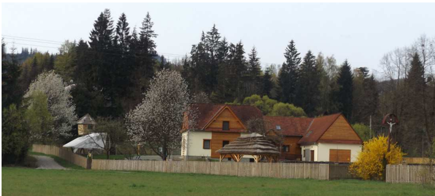
Zážitkové centrum URSUS v Dolní Lomné.

Velikost a zázemí města, dlouhá historie rozvoje rekreačního využívání, uvážlivý přístup vedení města ke svému rozvoji, stejně jako přírodní a dopravní předpoklady umožnily rozvoj turistického ruchu bez zřejmých negativních dopadů. Snad jen v době pořádání některých populárních akcí vznikají problémy s průjezdem a parkováním. I tyto problémy se snaží město řešit a minimalizovat tak jejich dopad na místní obyvatele. Úžasný dojem z Rožnova, jakožto malebného městečka posazeného mezi horami, ale může pokazit stále se rozrůstající zástavba.