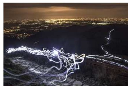
Noční fotografie ze závodu Beskydská sedmička.

Pevně věříme, že v Beskydech postupně převládnou závody honosící se prestižním označením „Přírodě přátelské závody“ ■