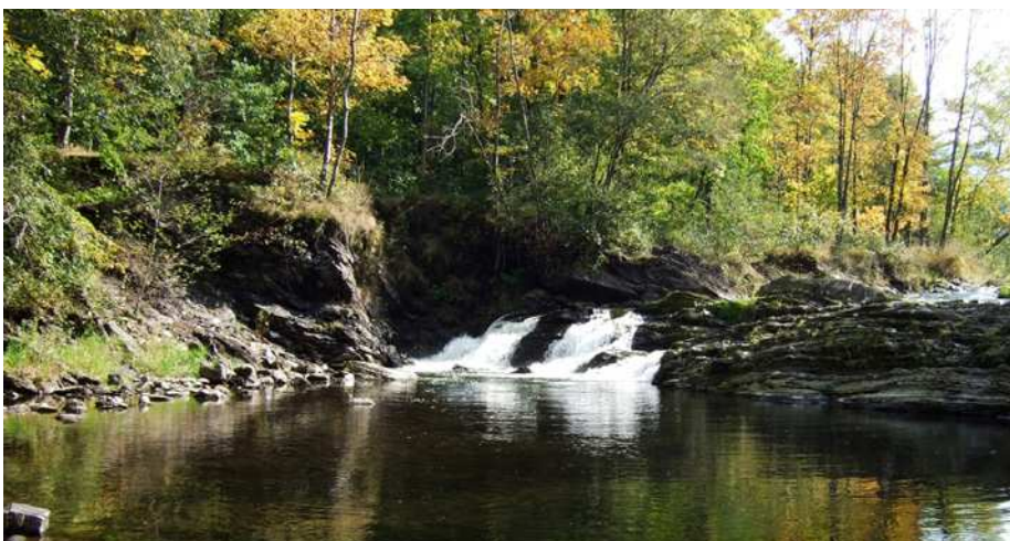
Peřeje na řece Ostravici.

Jaké místo ve zdejší krajině máte oblíbené