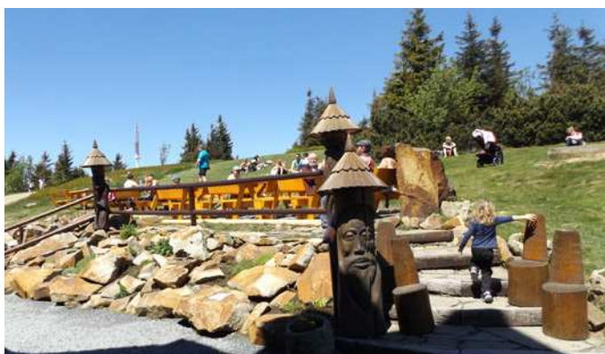
Horský hotel Radegast. Druhá zastávka, ale stále ne cíl. Stále nejste na vrcholu Radhoště.