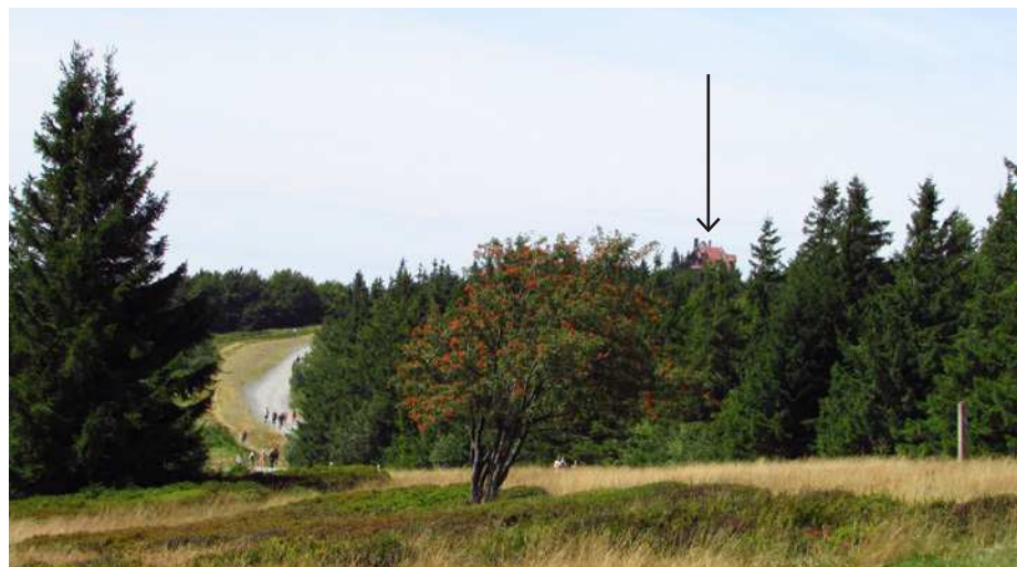
Pohled na hotel Radegast dnes.