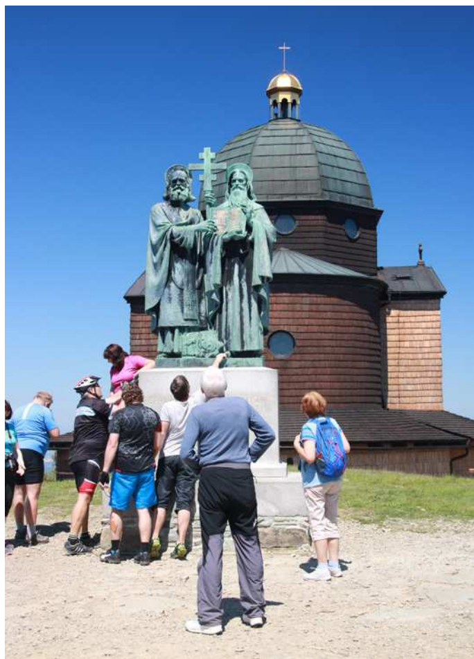
Cíl. Tak tohle je Radhošť. Z celkového počtu těch, co vyjdou z Pustevn, je to pouze zlomek výletníků, kteří dojdou až sem.