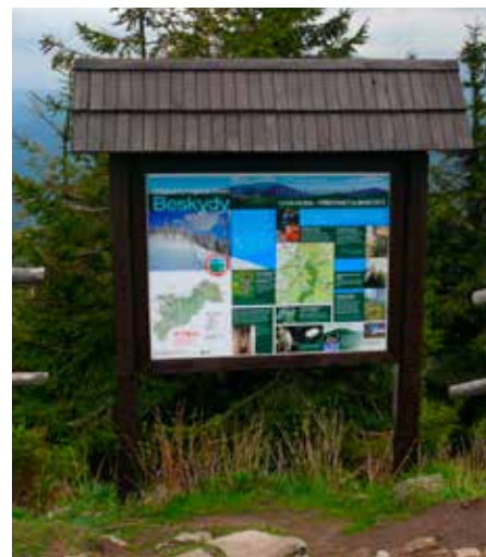
Informační panel na Lysé hoře

Příležitostí jak se zviditelnit jsou také různá výročí. Od r. 1999 Správa CHKO pravidelně pořádá různé akce pro veřejnost u příležitosti Evropského dne parků (24. 5.), více se