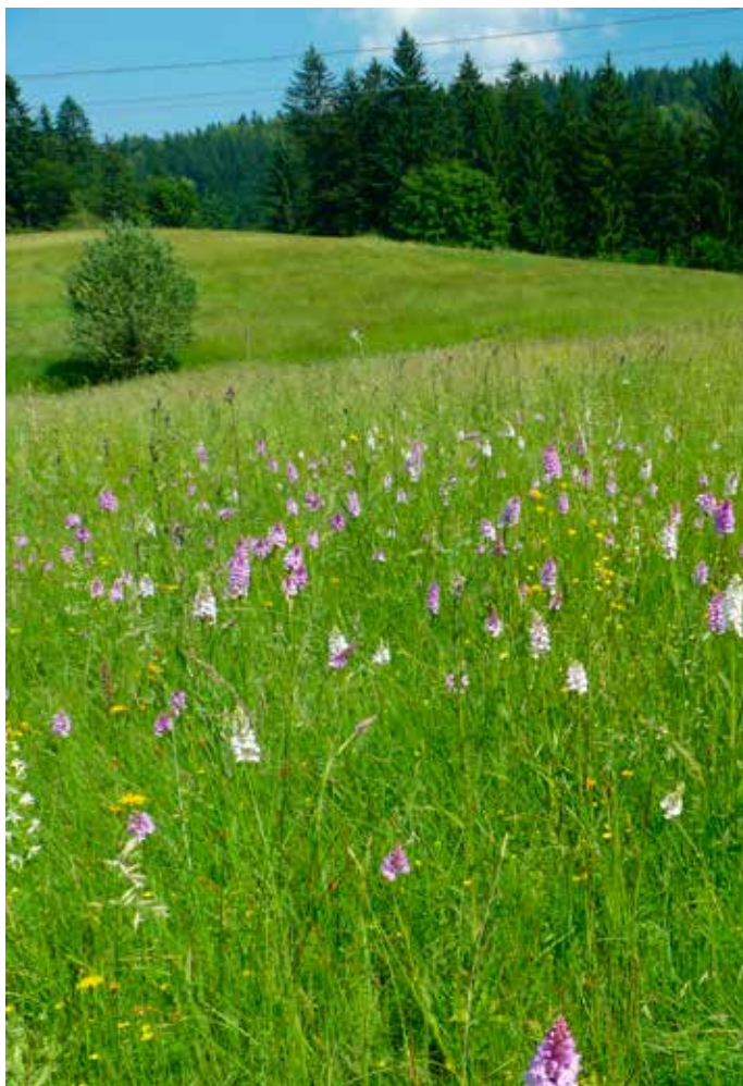
Na Kudlačně každoročně rozkvétají stovky prstnatců.