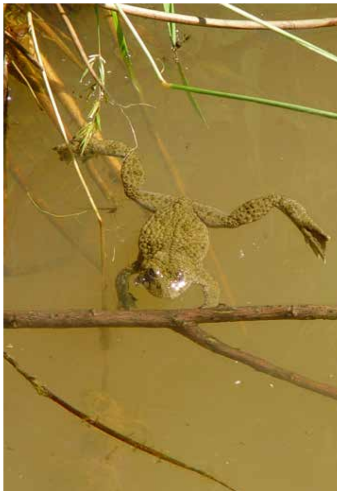
Drobná kuňka žlutobřichá vypadá velmi nenápadně, jak její název napovídá, její břišní strana těla je však výrazně žlutá.