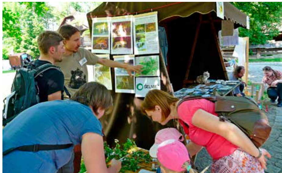
Stánek Hnutí Duha ve Valašském muzeu v Rožnově pod Radhoštěm

Vzdělávací a osvětové aktivity jsou nedílnou součástí naší práce na ochraně velkých šelem. Bez toho, aby lidé měli k šelmám kladný vztah a dostatek nezkradených informací o nich, není možné velké šelmy efektivně chránit. Širokou veřejnost se proto snažíme oslovit prostřednictvím webu www.selmy.cz , kde pravidelně zveřejňujeme šelmí zajímavosti ze zahraničí i od nás, na jaře jsme také spustili on-line mapu ukazující život a ohrožení velkých šelem v Beskydech ( www.mapa.selmy.cz ); rozesíláme též e-mailový zpravodaj s aktualitami ze světa šelem. Přes léto navštěvujeme různé lidové, kulturní či zábavní akce v podhorských obcích s naším šelmím informačním stánkem, abychom s místními lidmi mohli osobně diskutovat o jejich názorech na šelmy a seznámit je s některými málo známými skutečnostmi ze života rysů, vlků a medvědů.