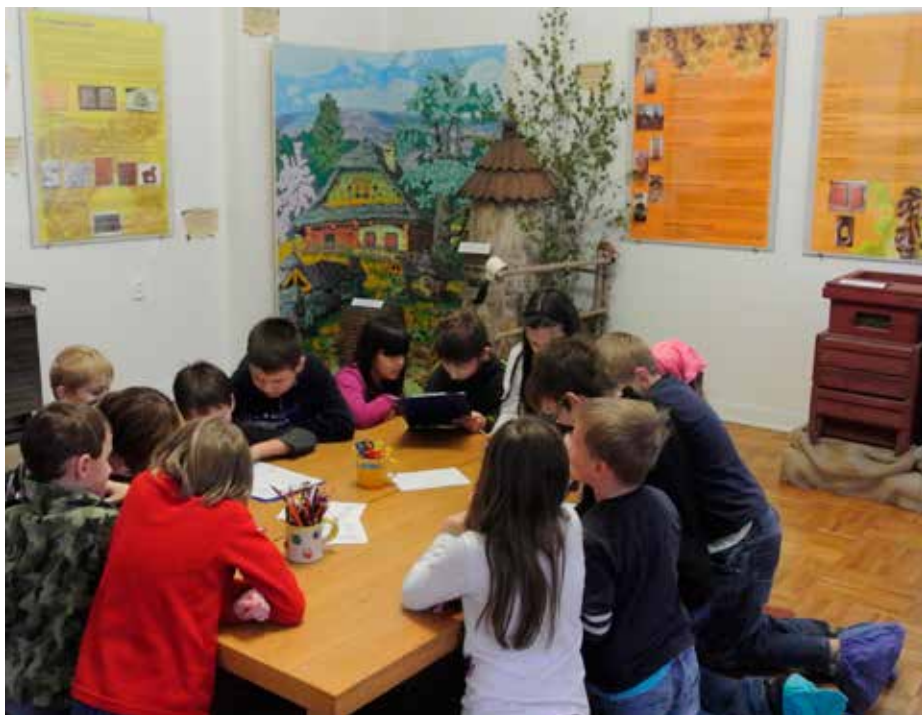
Jeden z výukových programů Muzea regionu Valašsko

Meziříčí, realizace školních výukových programů pro MŠ a ZŠ, zaměřených na nejrůznější témata přírody, ale i např. zachování tradic a lidových řemesel na Valašsku. V posledních letech se díky přijatým projektům „Valašské centrum pro udržitelný rozvoj“ a „Příroda nezná hranic“ velmi intenzivně věnujeme také osvětě a vzdělávání laické i odborné veřejnosti pořádáním osvětových exkurzí, seminářů a přednášek v úzké spolupráci se Slovenským svazem ochránců přírody a krajiny.