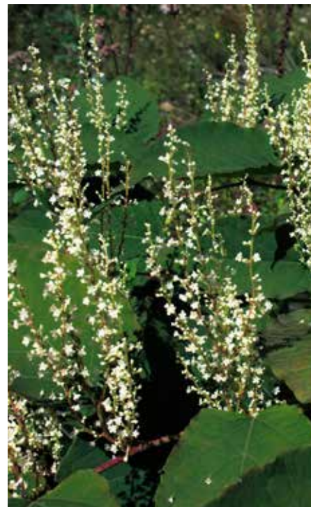
Invazní rostlina křídlatka v květu