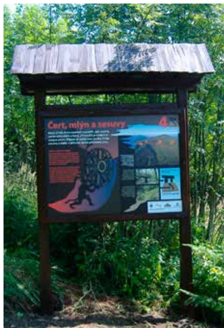
Jeden z panelů naučné stezky Čertův mlýn

Myslím, že dnes již existuje řada příkladů dobře zvládnuté interpretace. Naučné stezky, které realizoval ČSOP Salamandr v Beskydech nebo Actaea v Jeseníkách, patří k těm nejlepším naučným stezkám, co u nás máme. Pořád je co zlepšovat a pořád se musíme učit z vlastních chyb. Tak to je všude a je to ten nejlepší způsob, jak se to naučit dělat dobře.