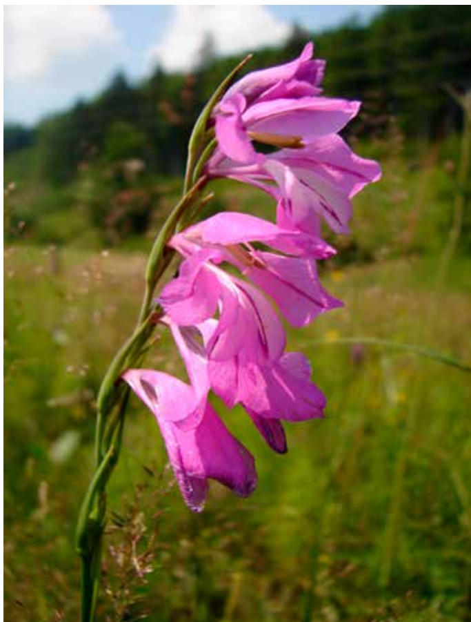
Mečík střečovitý je typickou rostlinou vlhkých luk, v minulosti byl používán k výrobě nejrůznějších nápojů lásky.