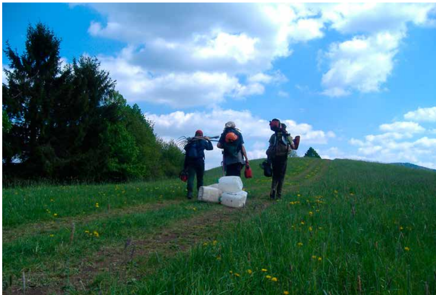
Pracovníci Salamandru jdou kosit