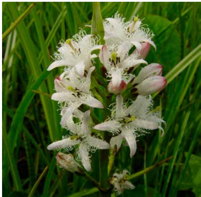
Hořký jetel je jedno z lidových jmen pro vachtu trojlistou. Říkalo se jí tak pro její hořkou chuť a tvar listů podobných jeteli.