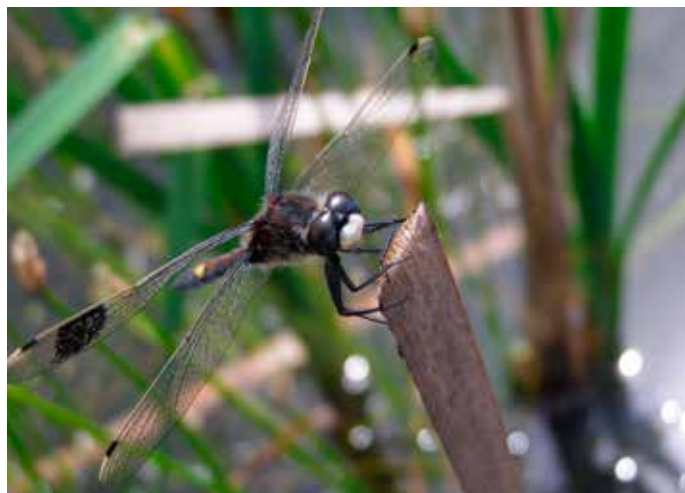
U zdejších tůněk můžeme spatřit vzácnou vážku jasnokvrnnou. Tu poznáme podle žluté skvrny, kterou má na zadečku.