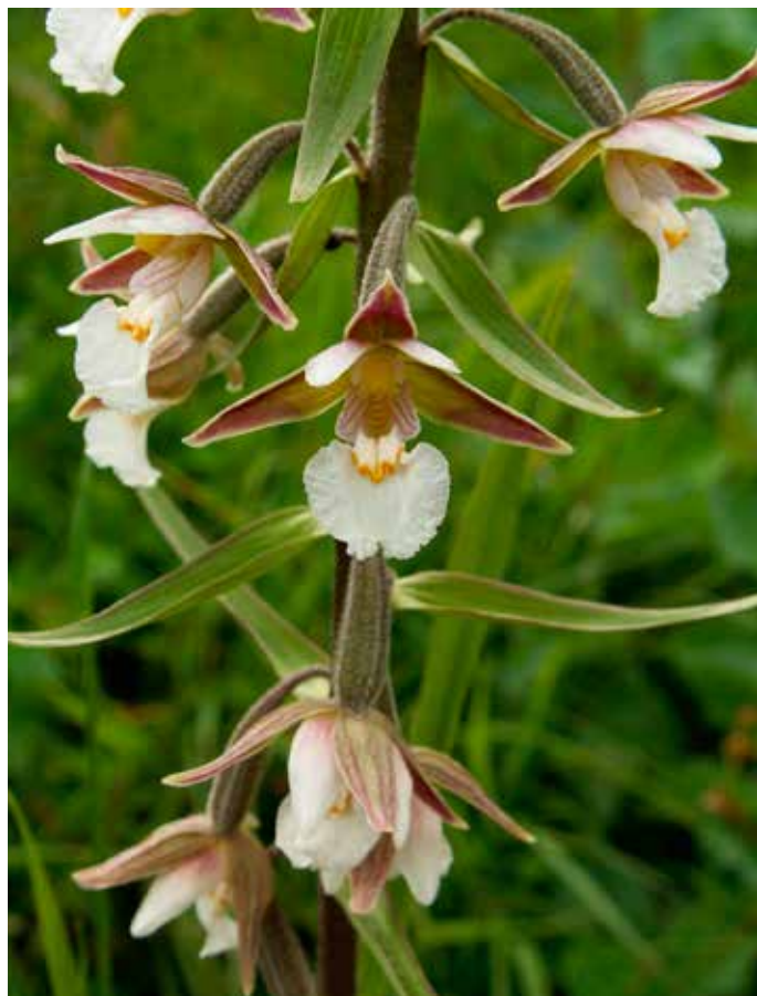
Orchidej kruštík bahenní rozkvétá o něco později než prstnatce.