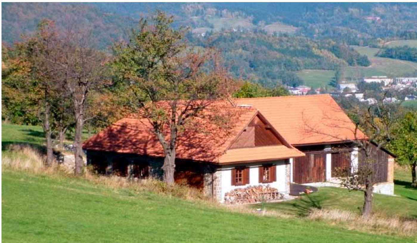
Usedlost na Končinách, Rožnov pod Radhoštěm

lípy, květnaté louky plné orchidejí nahradily golfové trávníky. Dříve místa, kde se skauti učili žít v souladu s lidmi a přírodou, nyní místa, kde rodiče učí své děti jak odpálit míček a porazit soupeře. Ale zkuste vyjít třeba ke Krošenkům nad Janovou a Hovězím. Ještě nedávno opuštěné a zarůstající hřebenové enklávy se již opět zelenají svěží trávou a barvami vracejících se motýlů a květin. Možná v duchu poděkujete, tak jako já, hospodářům, kteří na valašskou krajinu nezapomněli.