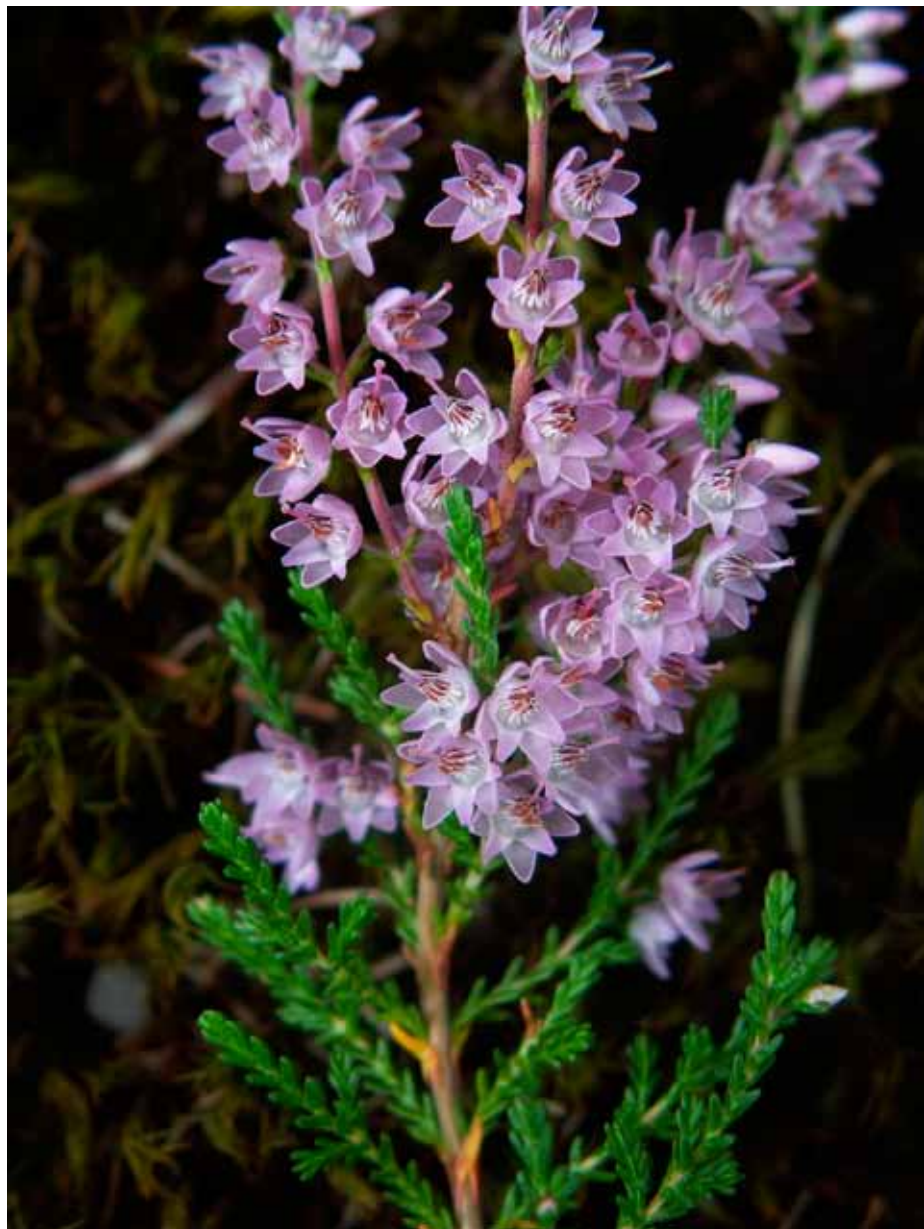
Vřes obecný je keřík, který dorůstá maximálně do výšky 50 cm. Na fotografii je poněkud v nadživotní velikosti.

• Konec legrace, smutno se rozhostilo ve chvíli, kdy „časně ráno víchř vyrazil okno a odnesl vylekanou andulku, která slyšela na jméno Pepíček Hyža“ – ani rojnice pracovníků Správy nedokázala naplnit naléhavou prosbu o její záchranu.