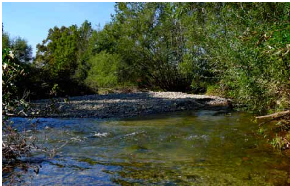
Štěrkový náplav na Rožnovské Bečvě