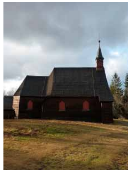
Kostel sv. Antonína Paduánského na Prašivé