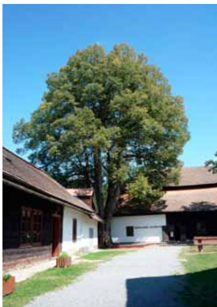
Lípa u Karlovského muzea