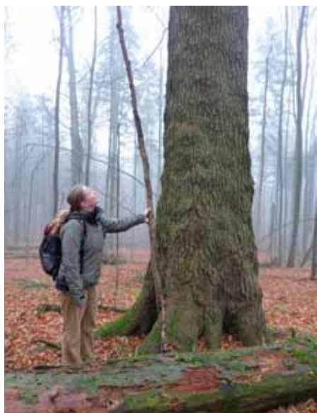
Jedna z jedlí v NPR Salajka