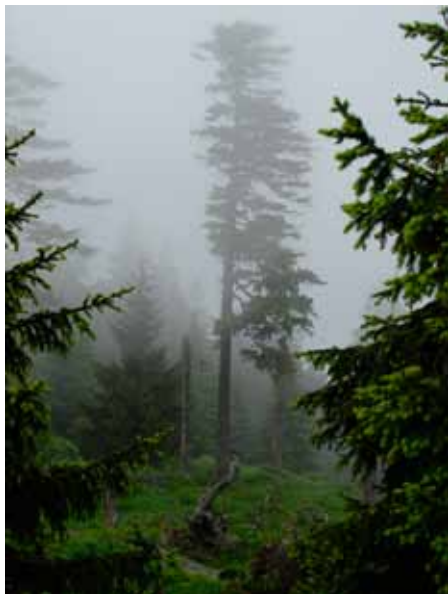
Mlhou zahalený les na Kněhyni