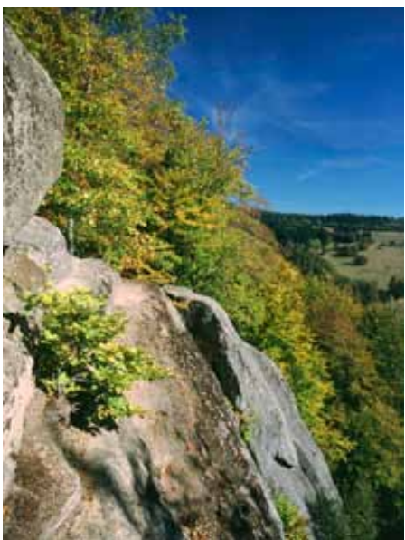
Vrchol Pulčínských skal Zámčisko