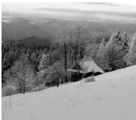
Jeden z výhledů po cestě na Javorníček

Beskydy jsou plné úžasných míst, která potěší fotografy. Někdo má rád daleké výhledy, jiný rozkvetlé louky, další hledá roubenky nebo ovečky. Ve Velkých Karlovicích, na hřebenu Javorníčku, můžeme najít všechno pohromadě. Po turistické značce se vydáme