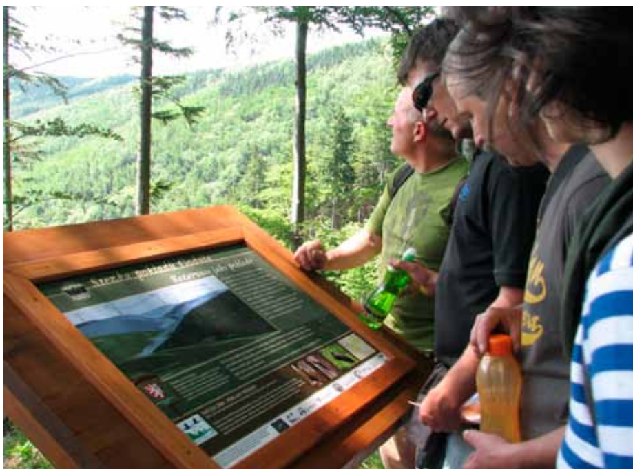
Jeden z panelů Stezky pokladů Godula

Místo maturitního vysvědčení dostala naše CHKO „titul“ evropsky významná lokalita a současně se jí narodily i dvě dítky v podobě tzv. ptačích oblastí – severní má jméno po „mamince“ Beskydy, jižní se nazývá Horní Vsacko. A tak by bylo možné pokračovat dále. Některé další položky z „životopisu“ naší CHKO najdete v rámečku. ■