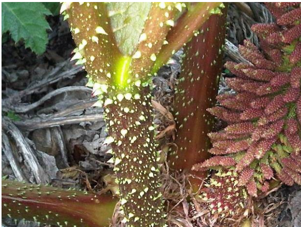
Obr. 3. Krátké trny na řapíku.

Roste na okrajích vlhkých lesů, na vlhkých loukách a v mokřadech, podél cest, v pobřežních oblastech a na útesech.