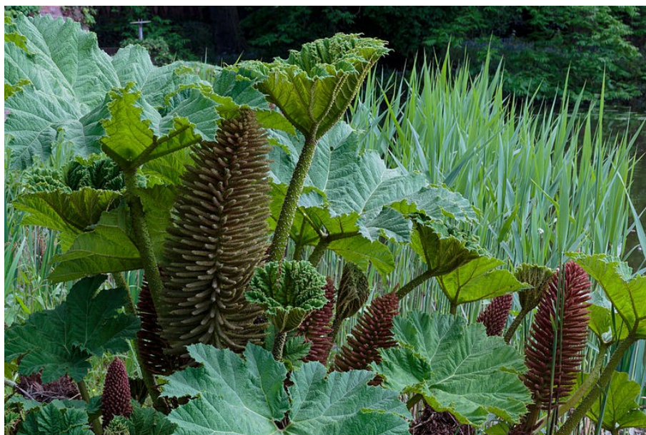
Obr. 6 Gunnera manicata se odlišuje více rozvolněným květenstvím.

Možnosti záměny: U nás neroste žádná podobná rostlina. V nekvetoucím stavu by její velké listy mohly vzdáleně připomínat bolševníky, další invazní rostliny na unijním seznamu, ve fázi kvetení je však nezaměnitelná. Velmi podobná je jí brazilská příbuzná Gunnera manicata , která se též v některých zemích pěstuje a od které se liší menším vzrůstem a kompaktnějším květenstvím.