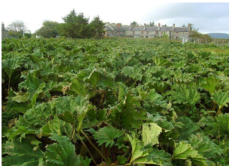
Obr. 1 Porost batory v Irsku.

Původ: Domovinou je jižní a střední Chile a patagonská Argentina.