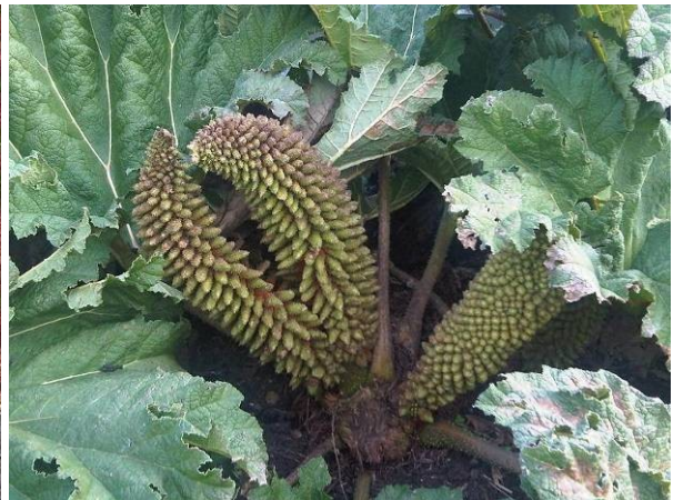
Obr. 4. Detail květenství.