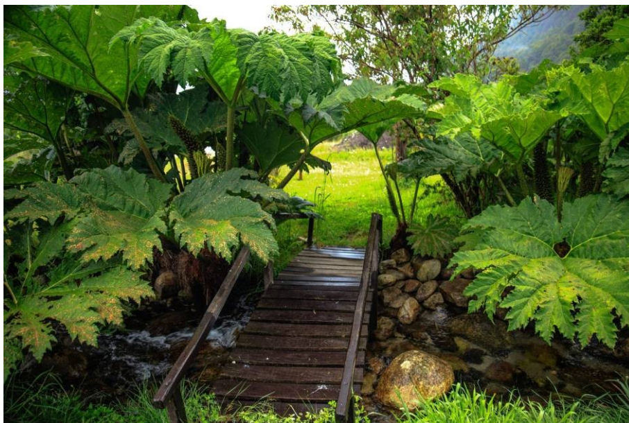
Obr.5 Batora chilská.